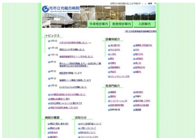
現在のホームページの トップページ