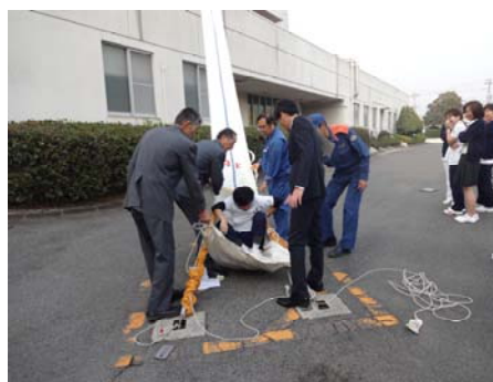
救助袋を用いた避難