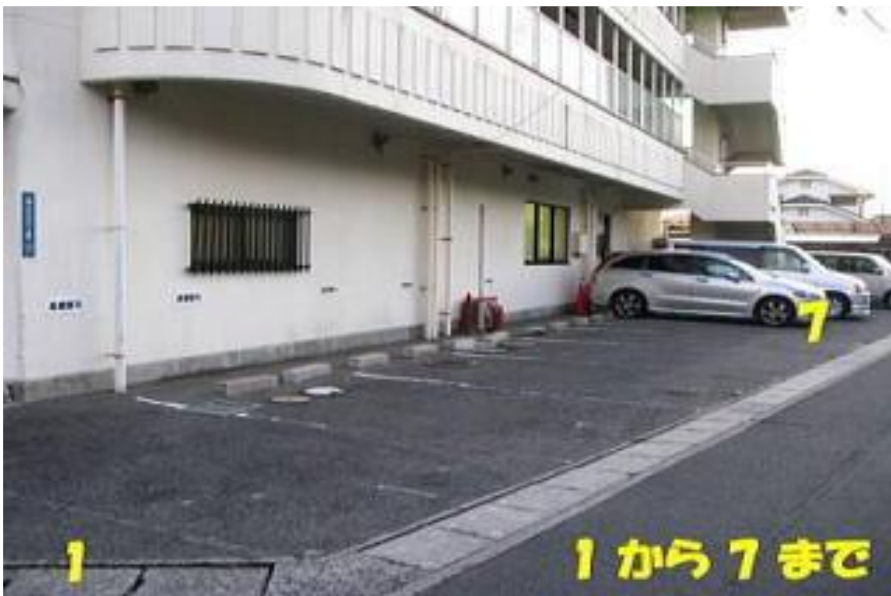
医院（山側）1～7 が当院の駐車場で