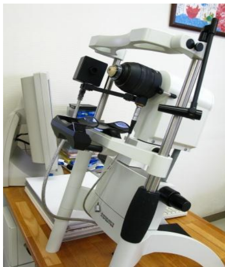
共焦点角膜顕微鏡