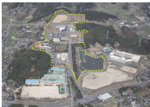
ひかりソフトパーク全景

新光総合病院は「ひかりソフトパークA～D区画」の緑に囲まれた高台に建設が進められています。近くには浅江小学校、光丘高等学校、福祉施設、商業施設等があり、光駅から北東へ約1 kmの位置にあります。